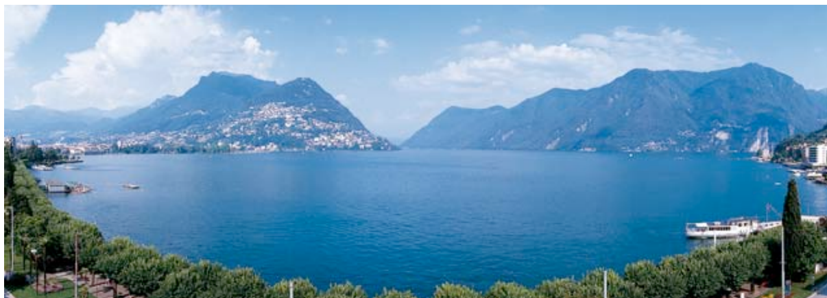
inspirierende Aussicht vom Konferenzraum "La Panoramica"

Das Best Western Hotel Bellevue au Lac ist ein traditionsreiches Haus mit familiärem Ambiente an der Seepromenade von Lugano, nur wenige Gehminuten vom historischen Stadtzentrum entfernt. Das Hotel verfügt über 3 Suiten, 10 Junior Suiten und 52 Doppel- und Einzelzimmer in den Kategorien Standard und Deluxe, die alle individuell, fröhlich und geschmackvoll eingerichtet sind und über einen Balkon mit schöner Sicht auf den See und die Berge verfügen. Alle Zimmer sind mit kostenlosem High Speed Internet Zugang (HSIA, mit Kabel) und einer regulierbaren Klimaanlage ausgestattet.